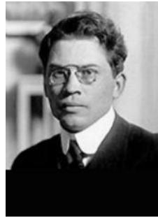
Fr. Tuglas 1917. aastal

Soome estofiile ühendav Tuglase selts tähistab juubelit