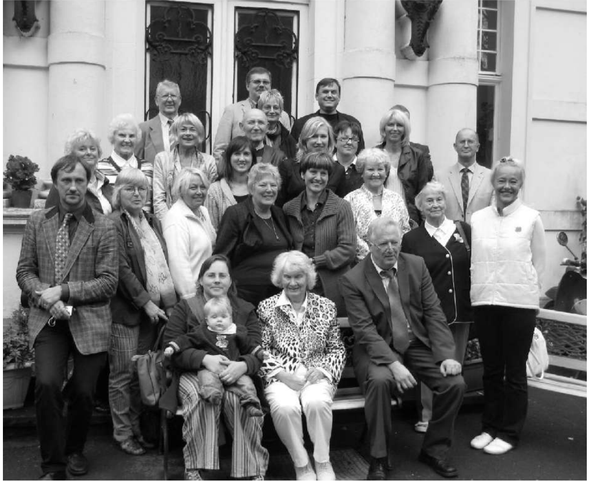
Traditsiooniline grupipilt trepil