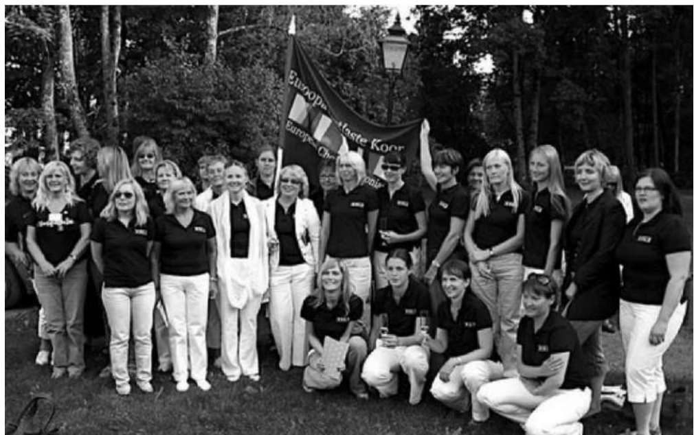
Euroopa Eestlaste Koori sopranid ja aldid Mäetaguse mõisas pärast kontserti

Euroopa Eestlaste Koori, Saksamaa eestlaste EÜSLi projektkoori ja Soome eestlaste segakoori Siller suur suvine ühislaululaager toimus sel suvel Aegviidu puhkebaasis Eestis. Kokku oli tulnud rohkem kui 60 lauljat.