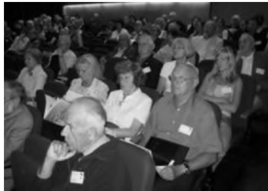
Huvilisi ja kuulajaid oli kohale tulnud nii siit- kui ka teistpoolt piiri