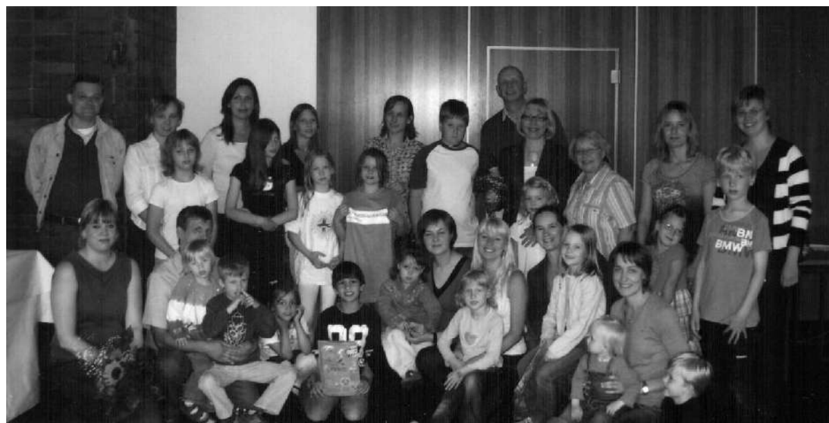
Viimane koolipäev enne suvevaheaega