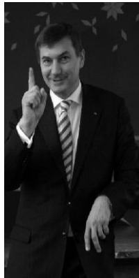
Peaminister Andrus Ansip

Peaminister Andrus Ansip tähistas 21. veebruaril koos Rootsi eestlastega Eesti Vabariigi 91. aastapäeva ja tänas oma kõnes pidulikul aktusel Immanueli kirikus eestlaste kogukonda välismaal pühendumuse ja töö eest, mida aastakümnete jooksul on Eesti Vabariigi heaks tehtud.