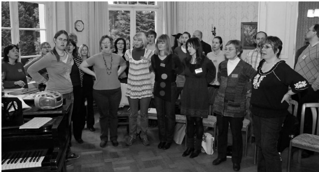
Sopranid hääli lahti laulmas