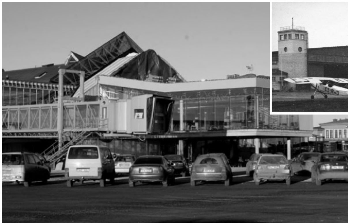
Vaade Vabariigi-aegsele lennuväljale

„Sellisest läbilaskevõimest peaks lähemal viiel aastal piisama, ent arvestades viimaste aastate kasvu reisijate mahus, võib öelda, et Tallinna lennujaam areneb nagu Tallinna linn, mis ei saa kunagi valmis,“ märkis Loik ja lisas, et juba