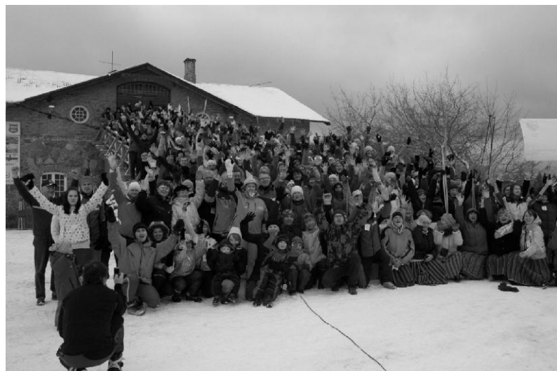
Ühispiilt matkal osalejatest