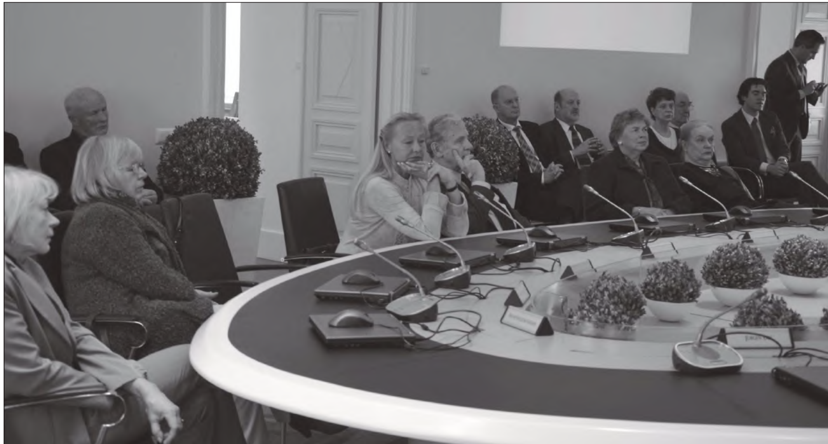
ÜEKNi delegaadid Tallinnas Stenbocki majas, kus kohtuti peaminister Andrus Ansipiga.

Täiskogu otsustas enda peale tagasi võtta koordineeriva ülesande ESTOde toimumiskohtade valikul tulevikus. Järgmine ESTO toimub 2013. aastal San Franciscos koos Lääneranniku Eesti Päevadega, kus ÜEKN korraldab Rahvuskongressi. Eestlaste