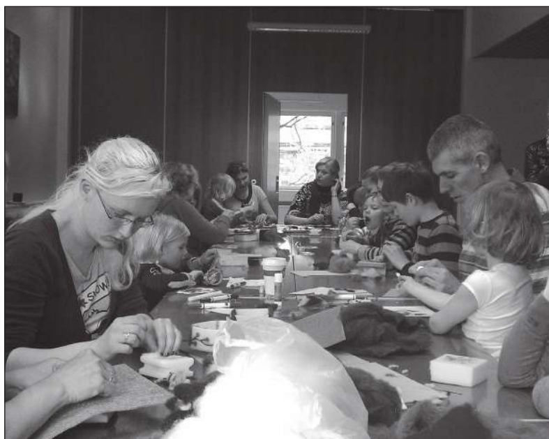
Hamburgi Eesti Kooli lapsed ja lapsevanemad viltimistehnikaid harjutamas.

Lisaks regulaarsele õppetööle oli lastel võimalik teha koos palju muudki huvitavat. Näiteks tehti kaks projektipäeva, mille kestel oli lastel ja nende vanematel võimalik tutvuda viltimistehnikaga ja proovida ka ise vildist erinevate loomade ning aksesuaaride meisterdamist. Mõlemad päevad olid ülimalt edukad – mida muud võiks arvata kümnetest murdunud nõeltest, mis usina viltimise käigus näppude vahel purunesid. Lisaks