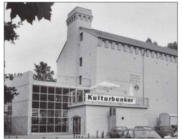
EÜSLi 60. aastapäeva pidustused toimuvad sõja ajal ehitatud õhukaitsepunkris. "...pidu siisugune kui omal ajal punkris" (Olaf Koppvilleni laulust "Klunker").

Praegu peavad EÜSL 60 korraldajad läbirääkimisi Kultuuripunkri läheduses olevate hotellidega, et peokülalistajate heaks välja kaubelda soodushinnad. Tulemustest teatame järgmises Eesti Rajas.