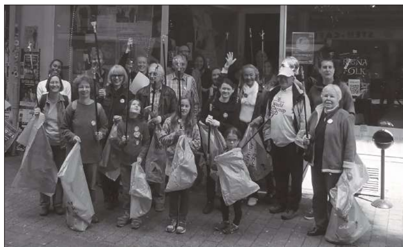
Stardivalmis talgulised Kohi-Kulturraumi ees...