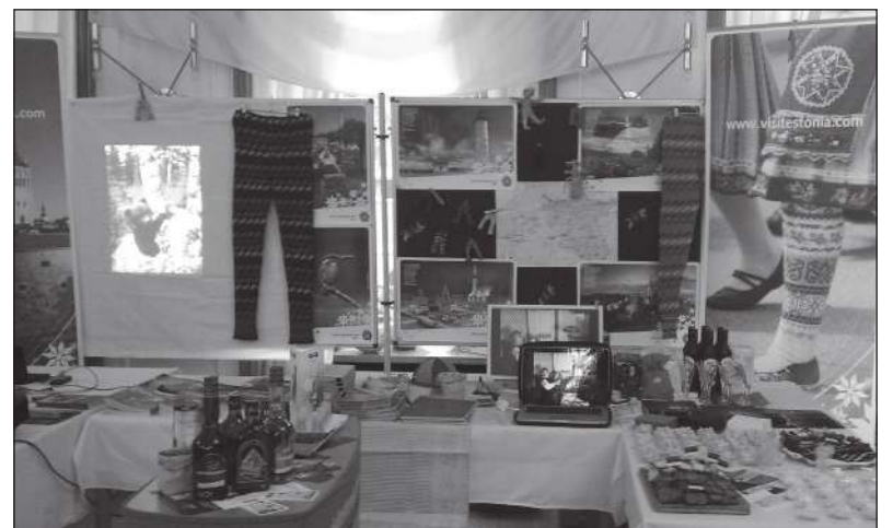
Eesti stend, eriti rahvusmustrites karupüksid ja meelepärased suupisted-napsud, ahvatlesid uudistajaid ligi astuma.

Eesti stendil jätkus huvilisi terveks õhtuks ja melu ei tahtnud vaibuda ka