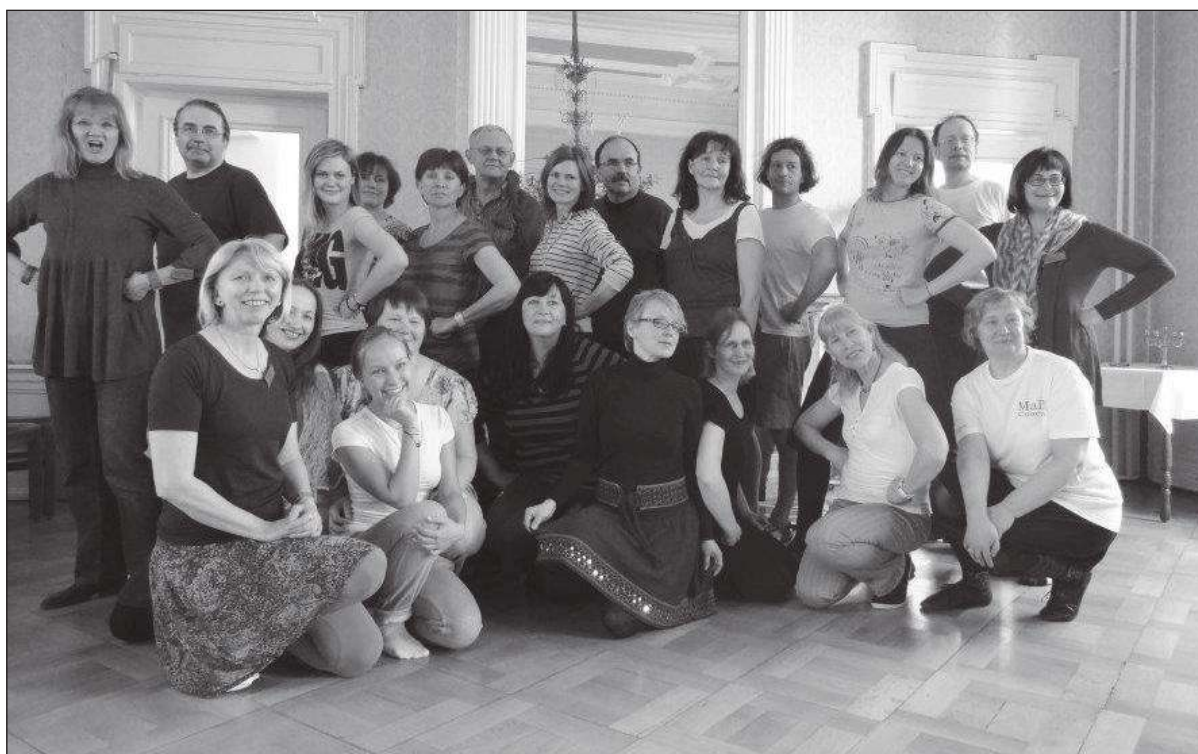
30. märtsist 1. aprillini keerutasid Annabergis jalga tantsusõbrad Iiriimaalt, Luksemburgist, Saksamaalt, Soomest.