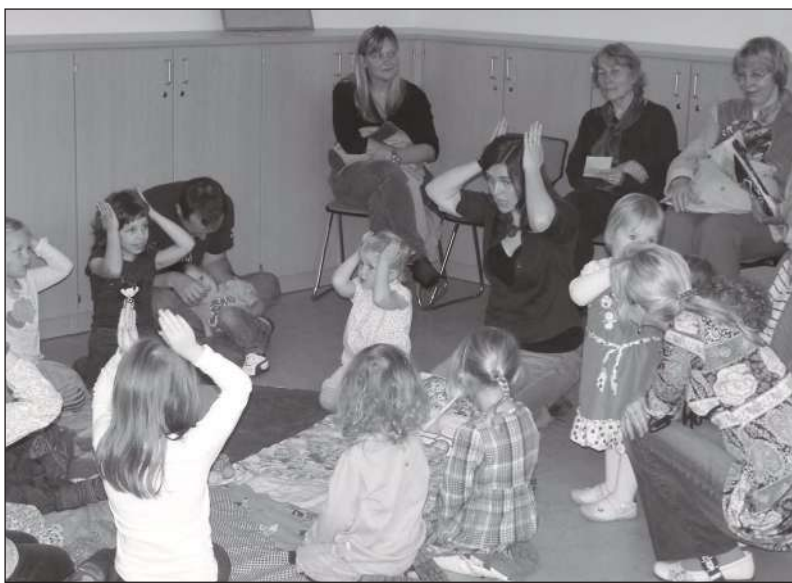
Avatud uste päeval jagus tegevust kõigile.