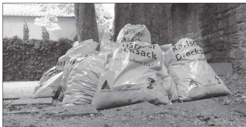
...ja saak pärast kahetunnist koristustööd.