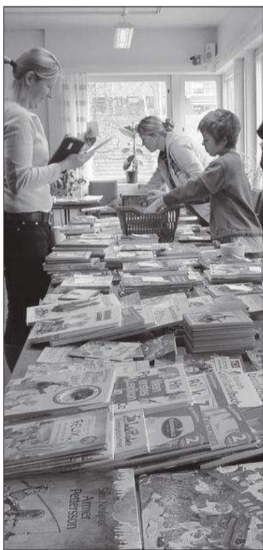
Laat mis laat!

Kohe pärast saali jõudmist algas seal kiire askeldamine – oli ju iga lapse sooviks kujundada oma laud kaasa võetud raamatutest omapäraselt ja võimalikult kaunit. Kümne-konna minuti möödudes võis ennist veel tühjade laudade asemel näha raamatukuhjaid ja nende tagant laste rõõmsalt säravaid pilke, mis esimesi ostlejaid oodates ärevalt ruumis siia-sinna liikusid. Siis algaski kauplemine: välja olid pandud nii eesti- kui ka saksakeelsed raamatud, ajakirjad, lauamängud – isegi üks kaunis paar tütarlaste uiske ootas huvilisi. Laudadel võis silmata palju nüüdisaegset eesti kirjandust, kuid ka mitukümmend aastat vanu eestikeelsed raamatuid, mis pärinesid veel ajast, kui olid pisikesed laste vanemad ja isegi vanavanemad. Sellised raamatud olidki kõige populaarsemad, sest neid pole võimalik osta mitte ühestki Saksamaa raamatukauplusest – selle üle oldi väga uhked ja seda enam märkasid lapsed, kui eriline ja omalaadne nende korraldatud raamatulaat on. Et kauplemist veel põnevamaks muu-