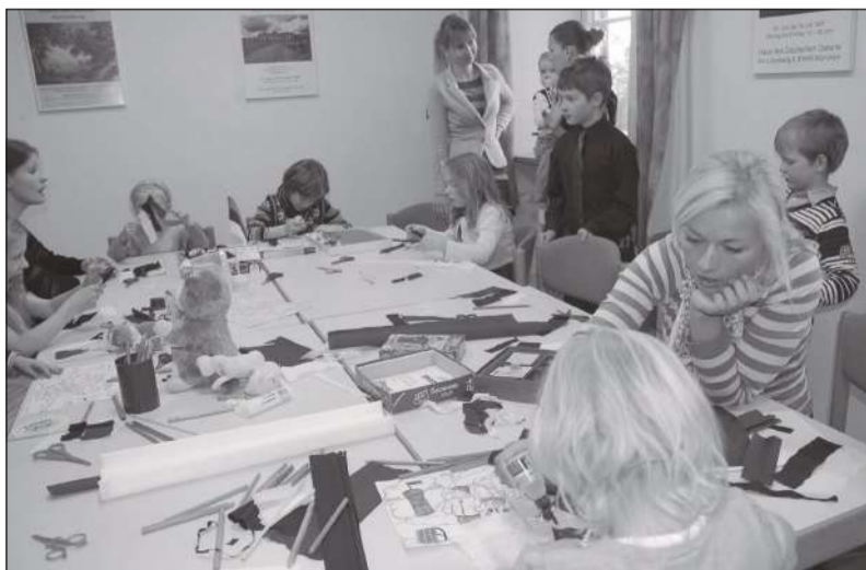
Lastele oli tegevust – Eesti lipu valmistamine ja joonistamine.

dus heade vestluspartnerite kõrval linnutiivul.