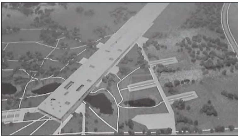
Eesti Rahva Muuseumi uue hoone makett.