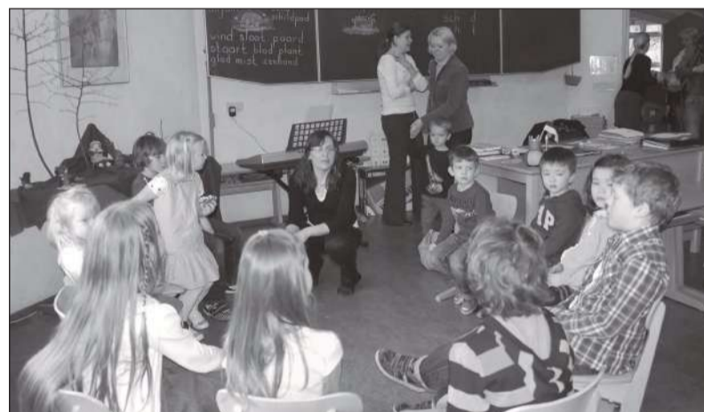
Muusikatund Gouda Eesti Koolis.

Pühapäev oli just õpetajaile see kõige põnevam – sai näha, kuidas Gouda Eesti Koolis õppetöö toimub. Eesti Kool Hollandis tegutseb alates 2007. aastast. Õppetöö toimub Gouda Vrije School ruumides üks kord kuus pühapäeviti. Koolis osaleb 25–30 last vanuses 0–11 aastat. Sporditund, laulmine, emakeel – eks ole palju sarnast, aga ehk ka midagi, mida oma töös üle võtta. Minule isiklikult jäi silma muusikaõpetaja, kes rääkis lastega vaikselt, aga selgelt ning mida vaikselt ta rääkis, seda tähelepanelikumalt lapsed kuulasid.