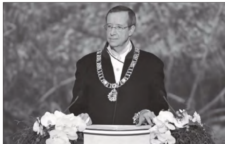
President Toomas Hendrik Ilves 24. veebruaril Tartus.