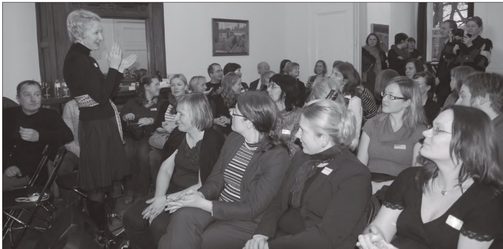
Euroopa Eesti koolide õpetajad Eesti saatkonnas Haagis ettekandeid kuulamas.