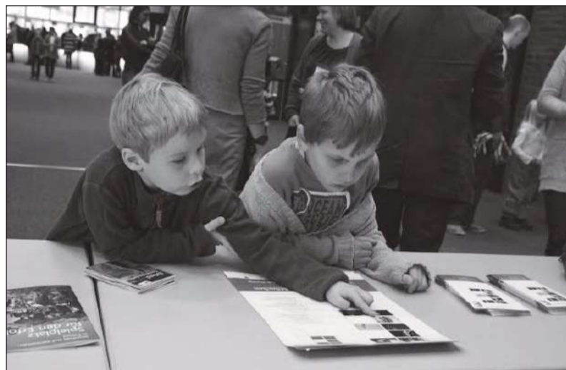
Väikesed kinohuvilised lemmikuid välja valimas.