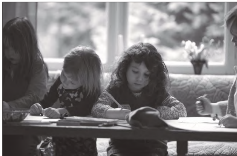
Head lapsed saavad end ise hoitud! Joonitamishoos...