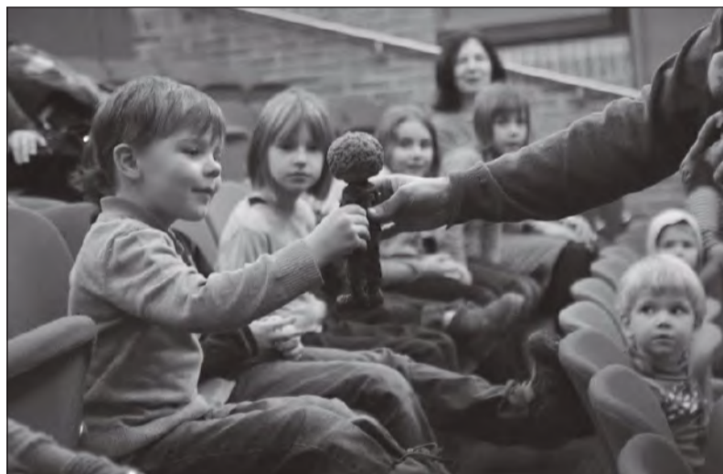
Kõige väiksemad said tutvust teha filminukkudega.