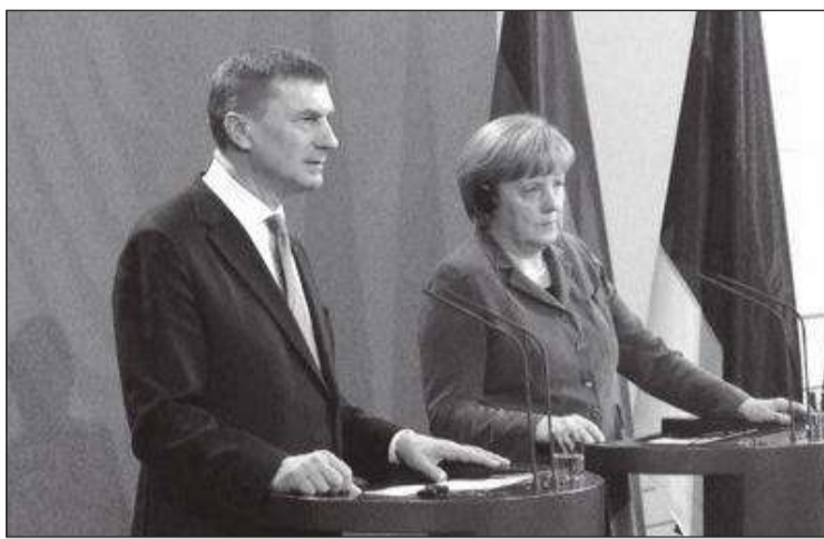
Peaminister Andrus Ansip ja Saksamaa liidukantsler Angela Merkel andsid pärast kohtumist ühise pressikonverentsi.

Kohtumisel Angela Merkeliga oli juttu ka Läti püüdlustest euroala