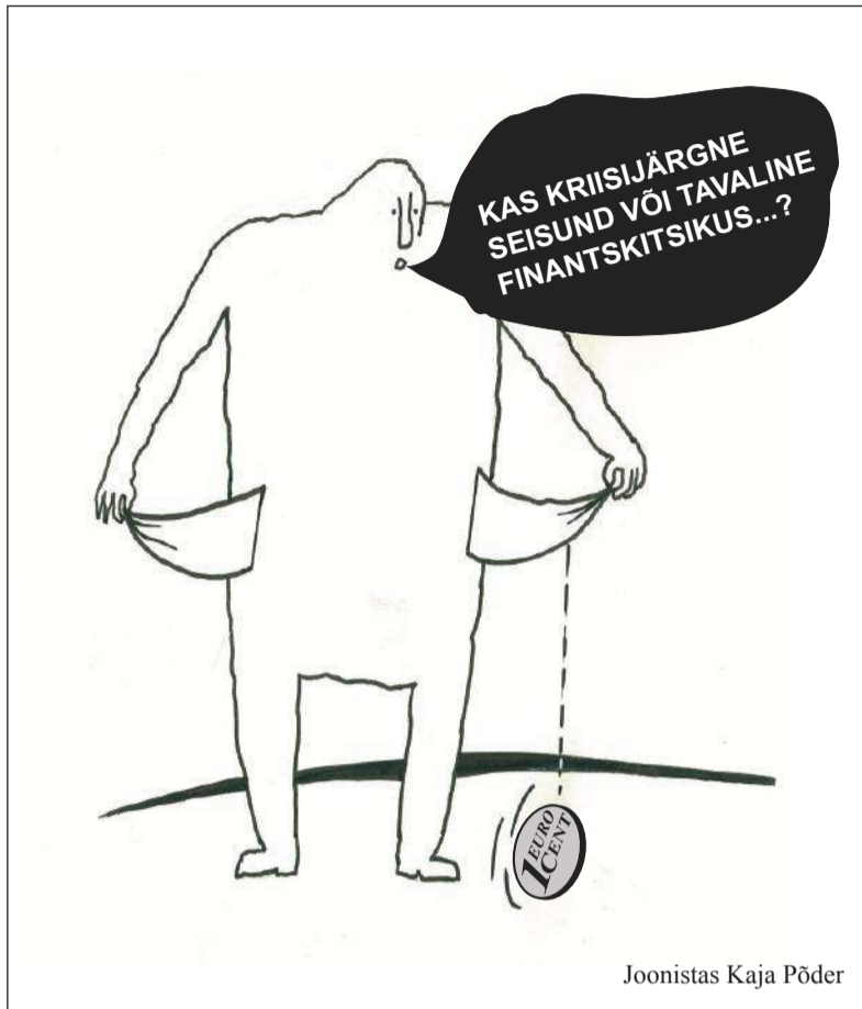
Joonistas Kaja Pöder

Üht tasub alati silmas pida – raha tuleb juurde ikka millegi tootmisest. Veel parem kui selle ekspordist. Nagu ka teenuste ekspordist. Kusjuures siseriiklikult üksteisele teenuste osutamine (üksteise üha suurema