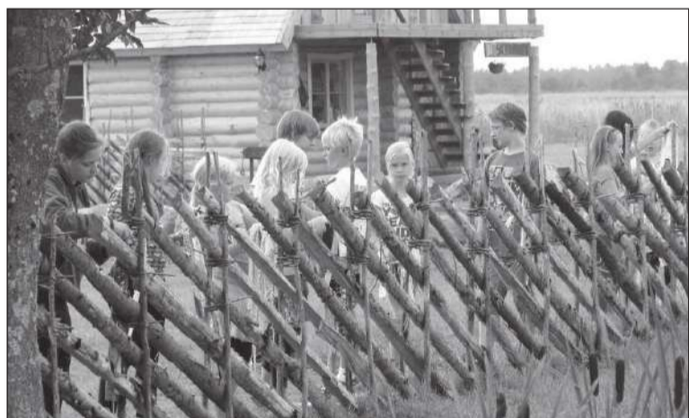
Fotomeenus mullusest laagrist.

Laste pärimuslaager "Saame kodus kokku" toimub sellel aastal 14.–17. augustini.