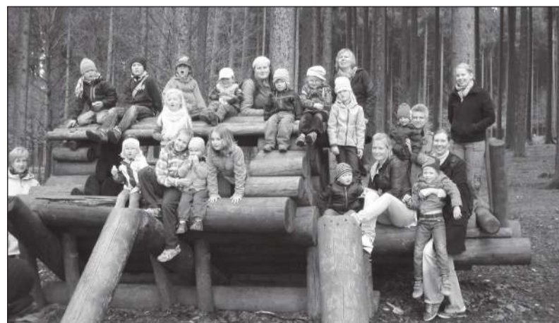
Aprillis külastas Müncheni Eesti Kool Poingu loomaparki.

Teisel päeval külastame Alatskivi lossi ja kohtume Tartumaal tuntud ja