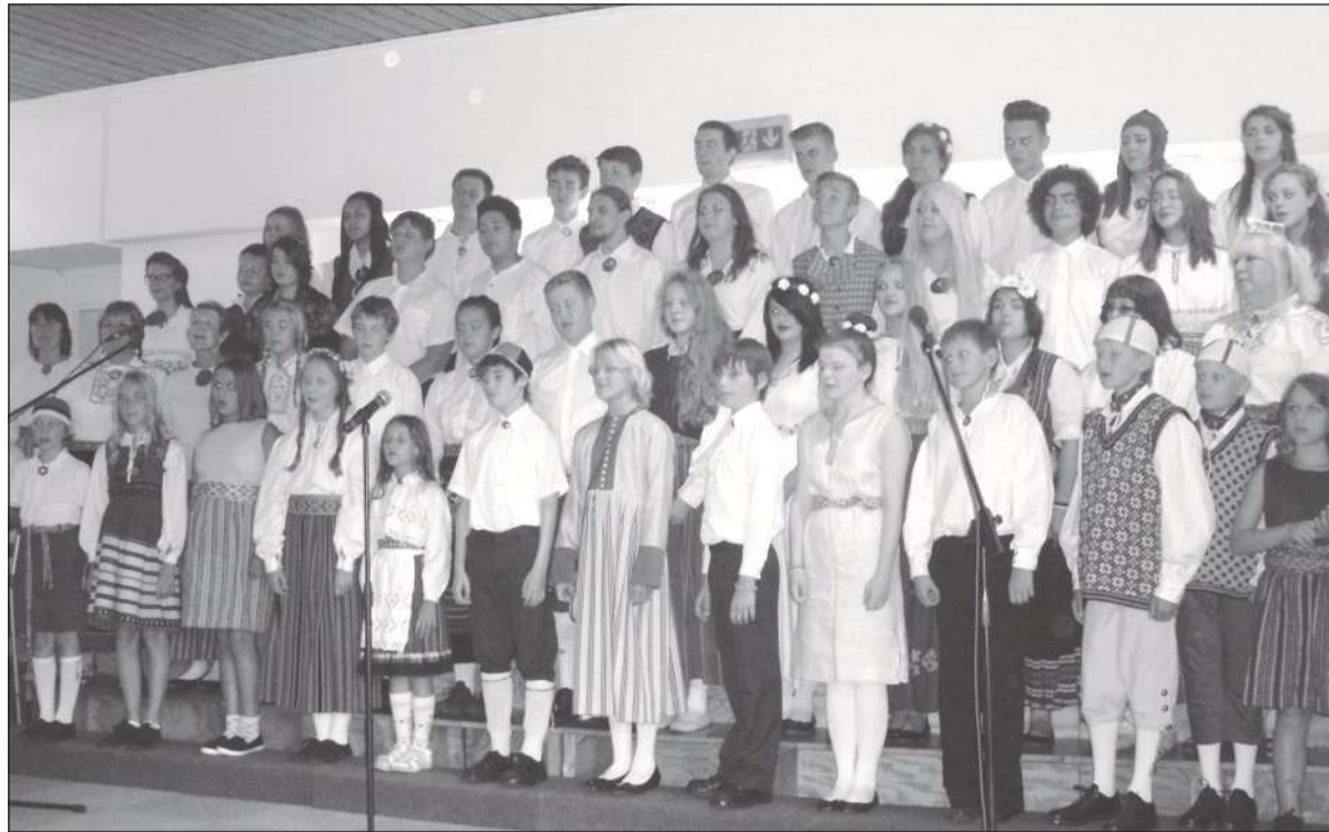
Suvelaagrilised Rahvapeol esinemas.

Tihti on just kulisside tagustesse piilumine see kõige põnevam. Seega sammusime noorte laagrimajade suu-