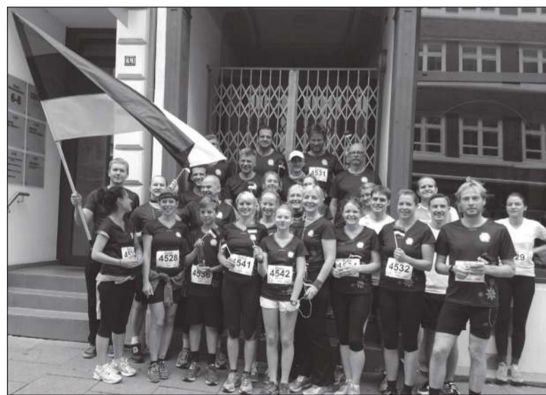
Eesti ja Eesti sõprade jooksugrupp Alsterlaufil.

Kõiki osalejaid ühendab tihe side Eestiga kas siis ärilisel, kultuurilisel või muul Eestile kasulikul moel. Jooksu eesmärk ei ole olnud tingimata üritada maailmarekordit purustada. Olulisem on rõõm jooksust ja edukas finiši ületamine, millega ka kõik osalejad edukalt hakkama said. Eestlane on sitke ega anna alla! Kuigi võib arvata, et hoolimata jooksust oli parimaks motiveerijaks peale finišijoont ootav soome saun koos eesti õllega, samuti uudishimu meie vihtlemiskunsti vastu.