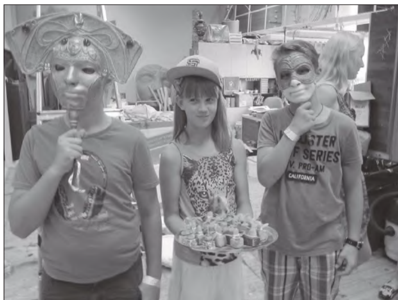
Lapsed Vanemuise teatri lavatagusega tutvumas.

Alustasime oma nädalavahetust AHHA Teaduskeskuses Tartus, kus suuremad lapsed proovisid šokolaadilaboris kätt magusameistrina. Noorte instruktorite juhendamisel valmisid ehtsad omatehtud šokolaadikommid. Kuni need külmkapis tahenesid, tutvusime omal käel meid ümbritseva looduse seaduste ja tehnika uemate saavutustega. Meie pisemaid köitis eelkõige vee-eksperimentide saal. Suuremad ja julgemad otsisid pigem närvikõdi, rippudes pea alaspidi, tõmmates end toolil istudes trossiga lae alla või sõites jalgrattaga kõrgel saali kohal kõiel. Kui poisse kiskus rohkem mootorite ja masinate