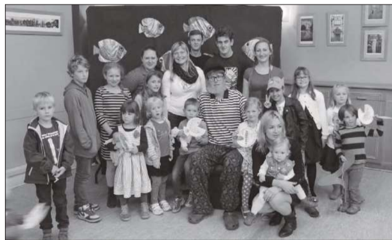
Koolilapsed, Teatribussi tegijad ja õpetajad.

Sel sügisel avab Berliini Eesti Kool pärast pikemat ettevalmistusperioodi oma ruumides raamatukogu. Raa-