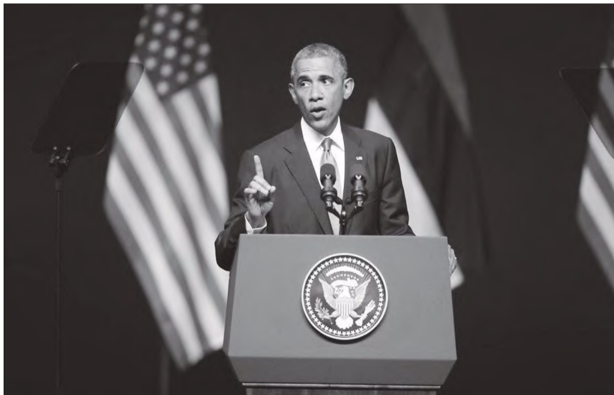
Maailma mõjuvõimsamaks isikuks peetav Barack Obama Tallinnas kõnet pidamas.

USA riigipea nentis, et iga liikmesriik peab täitma NATO ees võetud kohustusi. "Eesti on kiiduväärne, kuna on