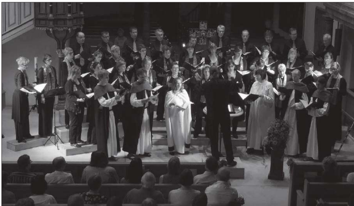
Vaimuliku koorimuusika vastu püsib huvi endiselt kõrge.