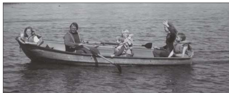
Paadisõit Kuremaa järvel.