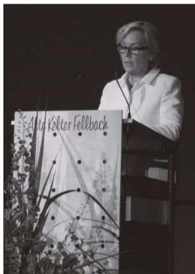
Eesti kultuuriminister Urve Tiidus kultuurisuvi avamisel.

Reedel, 18. juulil avati Fellbachi Alte Kelteris selleaastane Euroopa Kultuurisuvi. Festivali partnermaadeks on Soome ja Eesti. Vaatamata sel õhtul valitsenud suurele kuumusele, oli sissepääsu juures ohtrasti tunglemist ning saal sai rahvast pungil täis.