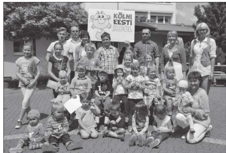
Viimane koolipäev tänavu juunis.