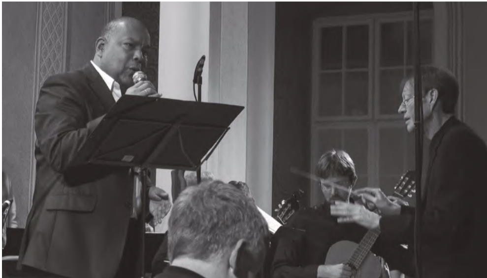
Eestile Eurovisiooni lauluvõistlusel esikoha toonud Dave Benton tõi koos lastekoori ja mandoliiniorkestriga jõulueelsesse aega palju emotsioone.

"Hallelujah" – selle tiitli all on väga palju muusikat kirjutatud, aga kuidas Kanada rokkpoet Leonard Cohen teemat käsitletud oli ning kuidas orkester, lastekoor ja Dave Benton lugu esitasid – see oli üks kontserdi kõrgpunktidest. Kergusega ja lihtsate muusikaliste vahenditega loodud Cohneni muusika kõlas lüüriliselt,