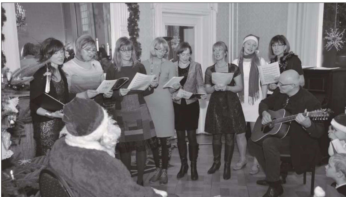
Jõuluvana oli paki lunastamiseks etteaste valmis nii suurtel kui ka väikestel.