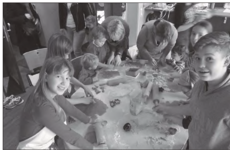
Jõulueelsel koolipäeval meisterdati MEKis piparkooke.