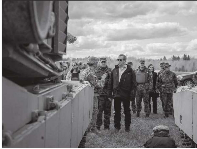
President Toomas Hendrik Ilves koostööd kaitsevæe suurõppusel Siil osalevate Eesti üksustega, staabiohvitseridega ning samuti liitlastega, Belgia õhutorjõu ja Ameerika Ühendriikide tankirühma võitlejatega.

Kaitseväe suurõppust Siil külastanud kaitsematerjal Sven Mikseri sõnul toimib Eesti riigikaitse süsteem usutavalt ning edukas Siil võttis jutud täiselukutselisele kaitsevæele üleminekust Eestis lõplikult päevakorrast maha.