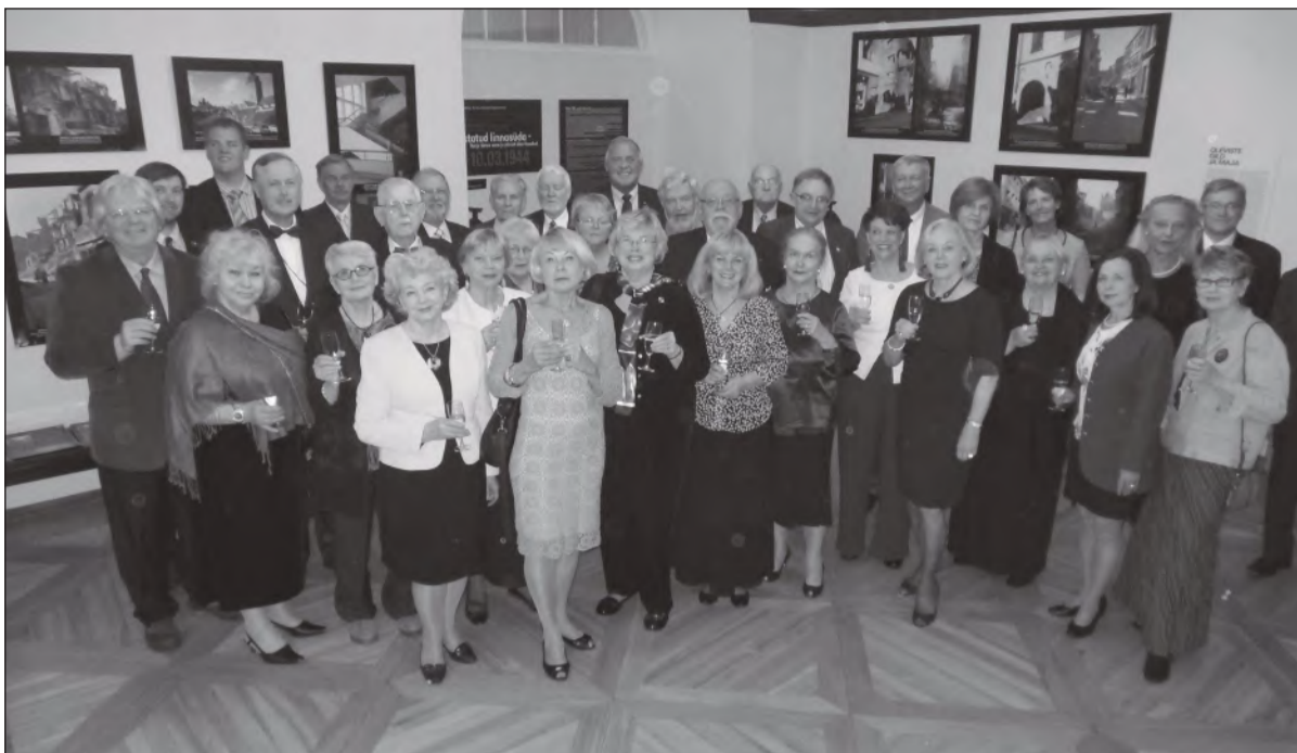
ÜEKNi täiskogu delegaadid ja külalised Mustpeade majas.