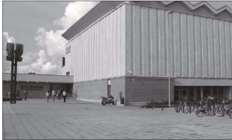
Tallinna Tehnikaülikoolis ulatub välisüliõpilaste arv 10 protsendini kogu õpilaskonnast.

Eesti kõrgkoolides õpib 2014/2015. õppeaastal tasemeõppes 2887 välisüliõpilast 101 riigist. Välisüliõpilaste moodustavad 5,2 protsenti üliõpilaste koguarvust (55 214) ja nende arv on