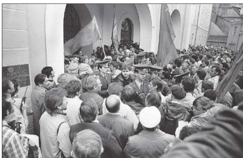
Interrinde suurimaks ettevõtmiseks jäi rahvakogunemise korraldamine 15. mail 1991, et rünnata Toompea lossi.

Järgnesid malevate loomine ja meeste väljaõpe, majandus- ning riigipiiri rajamine ning mehitamine, augustiputšiaegne tegevus, osalemine KGB ja EKP hoonete ülevõtmisel,