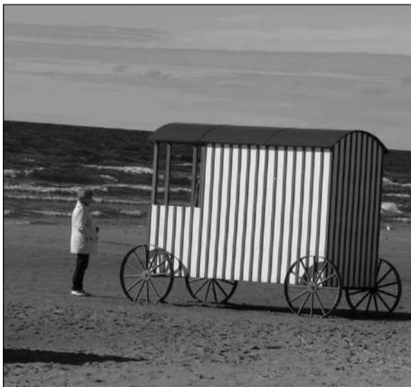
Supelsakste vanker Narva-Jõesuus.