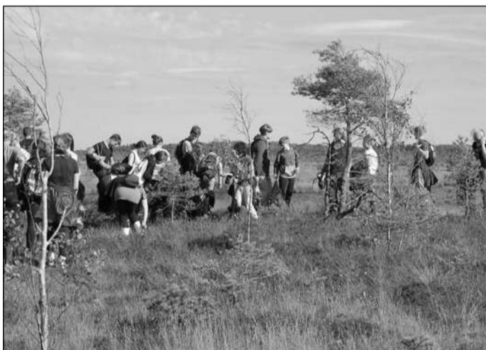
Räätsamatk Soomaa rabas tekitas suurt elevust.