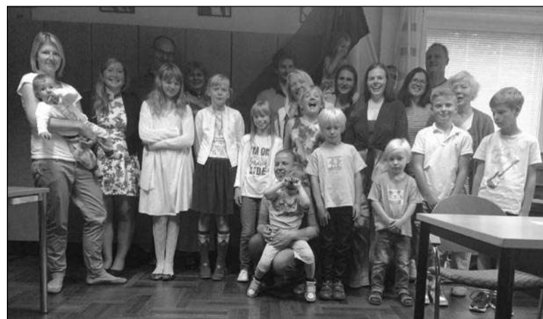
Hamburgi Eesti Kooli pere esimesel koolipäeval, 3. septembril.

Koolipäevad: 1. oktoober – ekskursioon Hamburgi väljarändajate muuseumisse; 5. november; 3. detsember. Jõulupidu 10. detsembril.