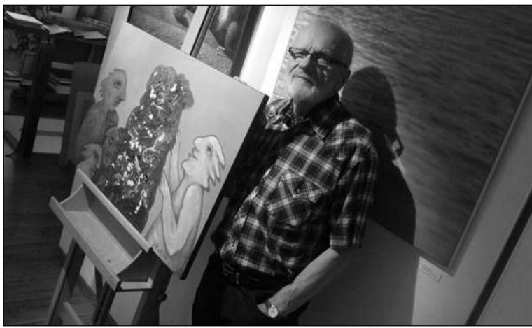
Jüri Arrak oma maaliga "Vastandid".