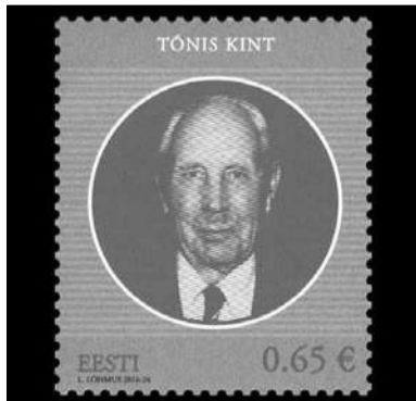
Tõnis Kindi portreega postmark on 16. Eesti Vabariigi riigipeade sarjas.

Nõukogude okupatsioonija alguses oli Tõnis Kind üks neist, kes kandideeris kommunistide juhtimisel moodustatud Eesti Töötava Rahva Liidu vastaskandidaadina Riigivolikogu valimistel. Tõnis Kind kustutati aga okupatsioonivõimude nõudel kandidaatide nimekirjast, kuna tema valimisplatvorm oli “Eesti rahvale kahjulik”, sellest ringkonnast osu-