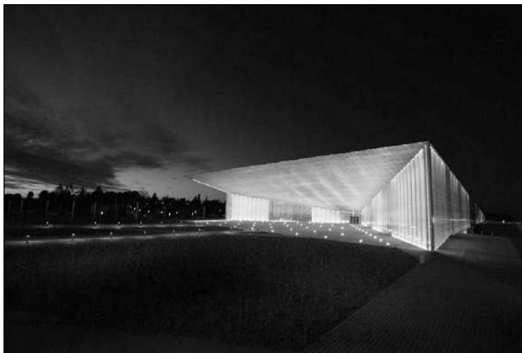
Eesti Rahva Muuseumi uus hoone Raadil.

Tarand mõnits, et aega jääb alati napiks ja alati on olemas risk, et mõni tehniline lahendus võib otustaval hetkel alt vedada, kuid ta oli siiski optimistlik. "Testimise ja harjutamise periood jäi lühikeseks. Ideaalis oleks olnud näiteks hea, kui