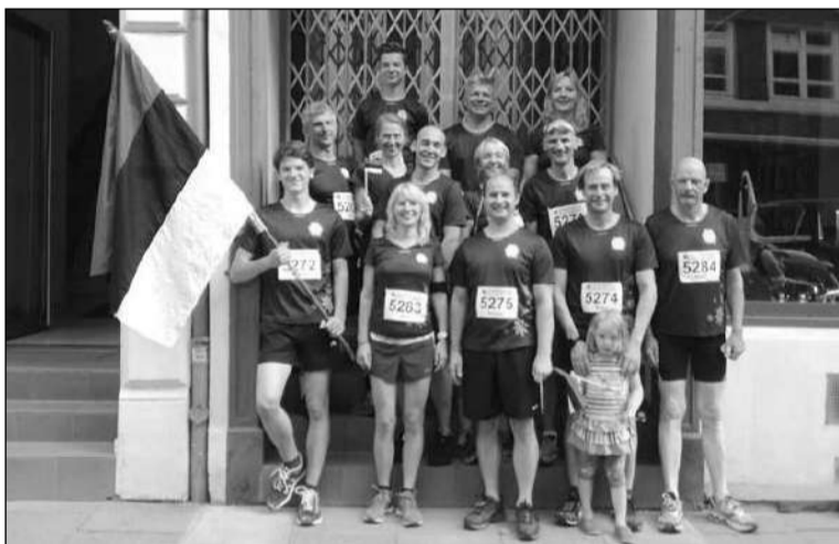
Eesti sõprade võidukas tiim 11. septembril ümber Alsteri jooksul Alsterlauf Hamburgis.

Maale on võimalik osta ka internetipõhises oksjonikeskkonnas www.haus.ee/oksjon kuni 8. oktoobrini 2016. ER