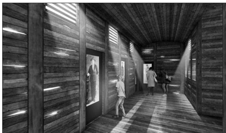
Küüditamist kajastava ekspositsiooni osa. (illustatsioon)

Muuseumi meeskond, uue ekspositsiooni kuraatorid ning mitmed ajaloolased, etnoloogid, kodanikuühenduste vedajad ja teised, kes on meile jõu ja nõuga abiks olnud, usuvad, et just selline külastaja teekond võimal-