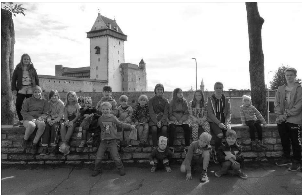
Müncheneri Eesti Kooli lapsed Hermannilinnuse juures.

Laagri lõpetasime Sinimägede muuseumis, kus lisaks ajaloo teemadele räägiti palju elust Ida-Virumaal nõukogude ajal ja tänapäeval. Ka lastele