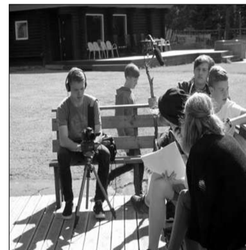
Filmivõtete ettevalmistused täies hoos.