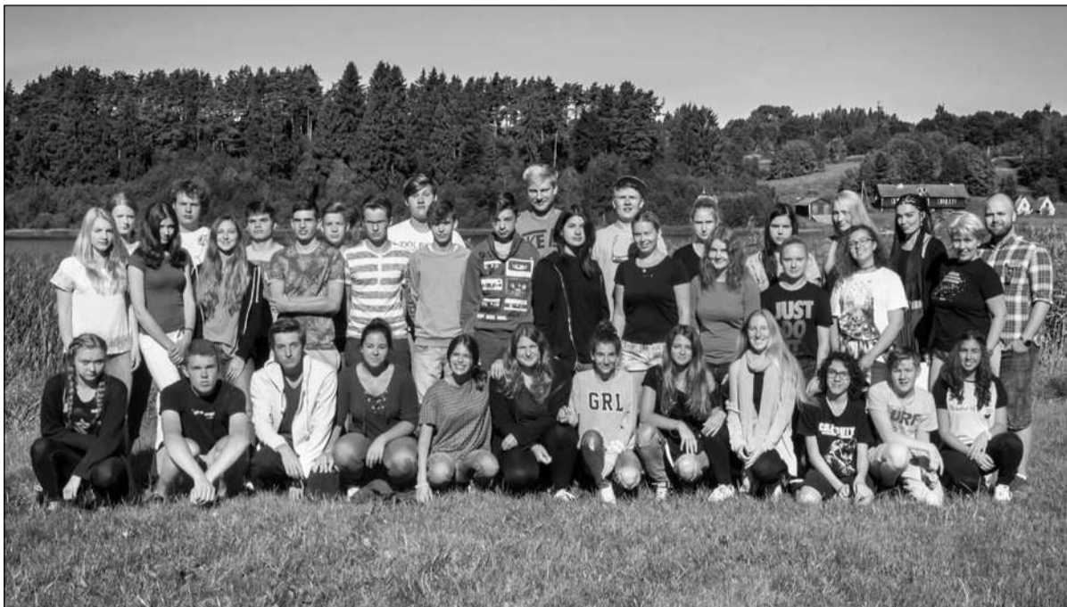
Noortevahetuse projektis osalenud noored.

Müncheni Eesti Kooli õpetaja ja noortevahetuse “Meie aja kangelased” Saksa grupijuht