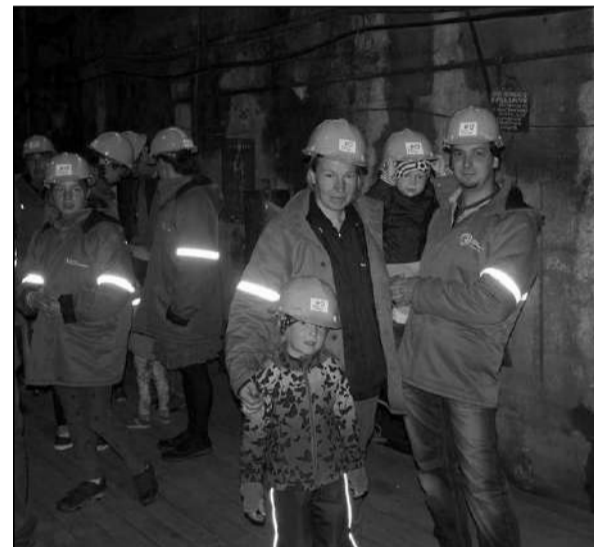
Eesti kaevandusmuuseumis Kohtla-Nõmmel.

jäi sealt nii mõndagi meelde: “Sinimägede ekskursioon meeldis mulle väga, kuna giid tegi selle minu jaoks väga huvitavaks ja kaasaelavaks. Giid rääkis väga huvitavalt eesti-vene suhetest enne Teist maailmasõda kui ka tänasel päeval. Meelde jäi ka see, kui muuseumis sai päris Kalašni-