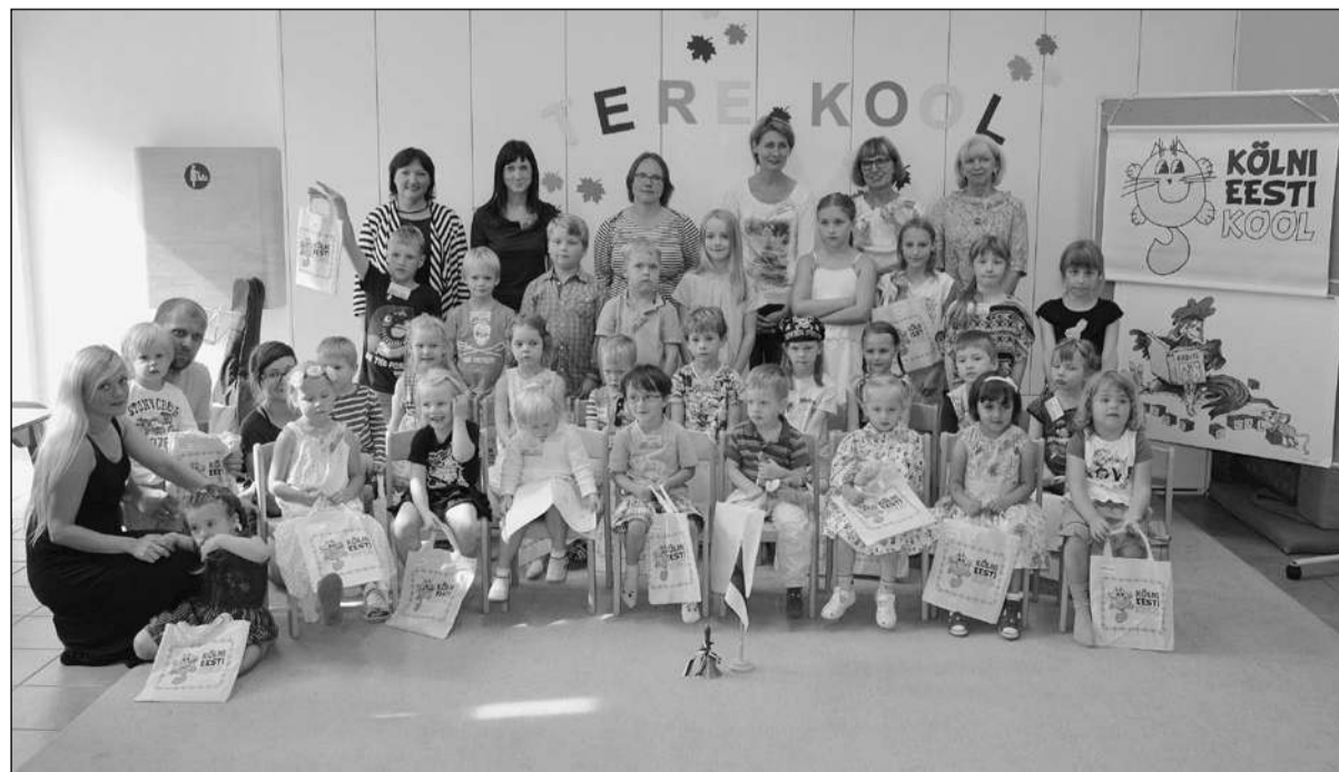
Kölni Eesti Kooli pere esimesel koolipäeval. Kölni Eesti Koolis alustavad sel hooajal õppetööga 41 õpilast ja 7 õpetajat. Lapsed said kingituseks kooli logoga kotid, mille sees oli Eesti Haridus- ja Teadusministeeriumi poolt saadetud eesti keele töövihikud.