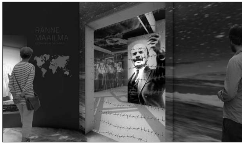
Eestit lahutava raudse eesriide. (illustatsioon)

dab nii tulevaste põlvkondadel, kui ka Eestit külastavatel turistidel mõista, kui habras on vabadus ning milliseid raskusi oleme seljatanud vabaduse taastamiseks. Vabadus elule, sõnavabadus, aga ka vabadus kodumaa randa külastada – kõik need on vabadused, millest muuseumi viimane osa kõneleb, pannes külastaja mõtlema, kuidas igaüks meist peab vabadust hoidma ja selle eest seisma.